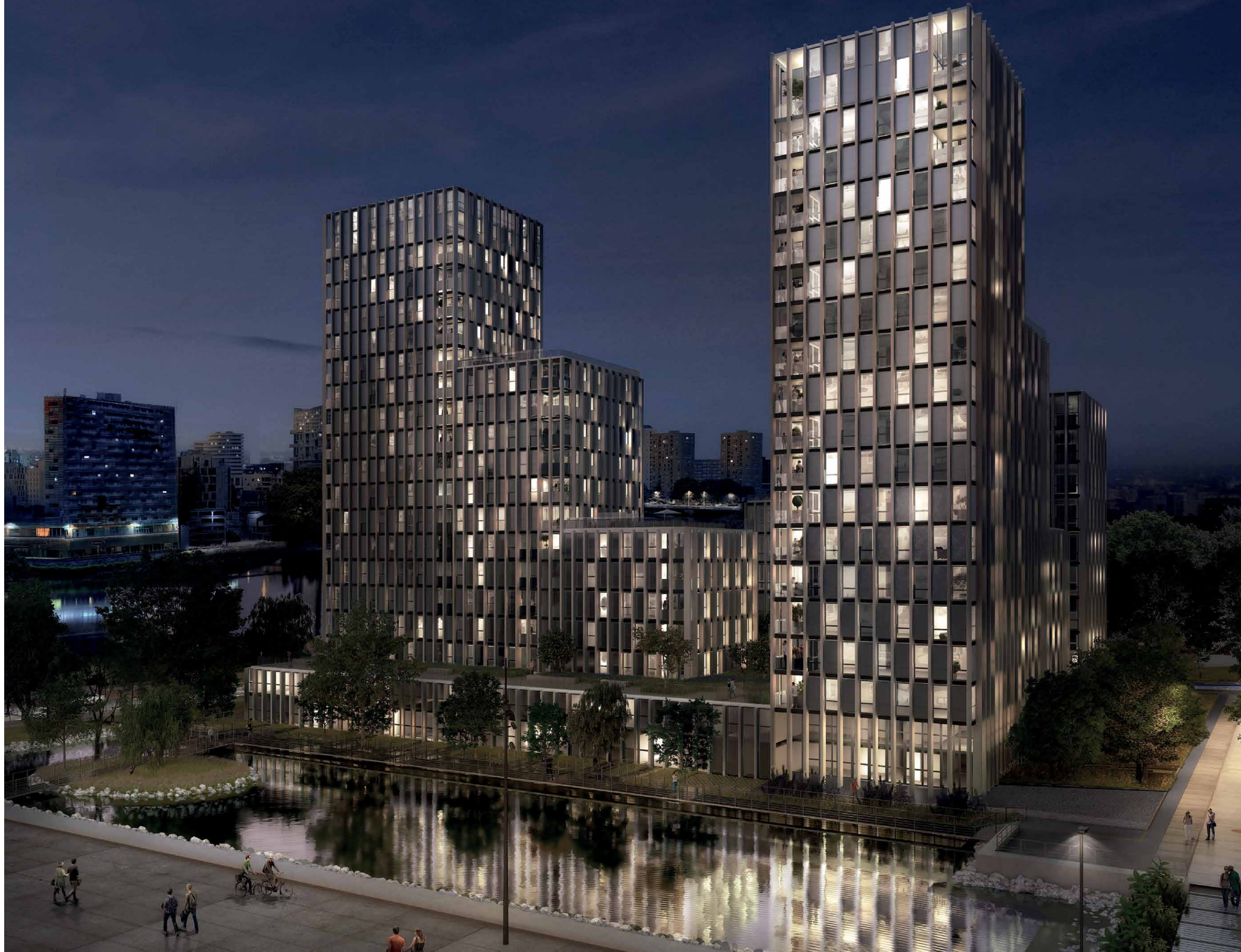
Vue depuis la promenade Europa