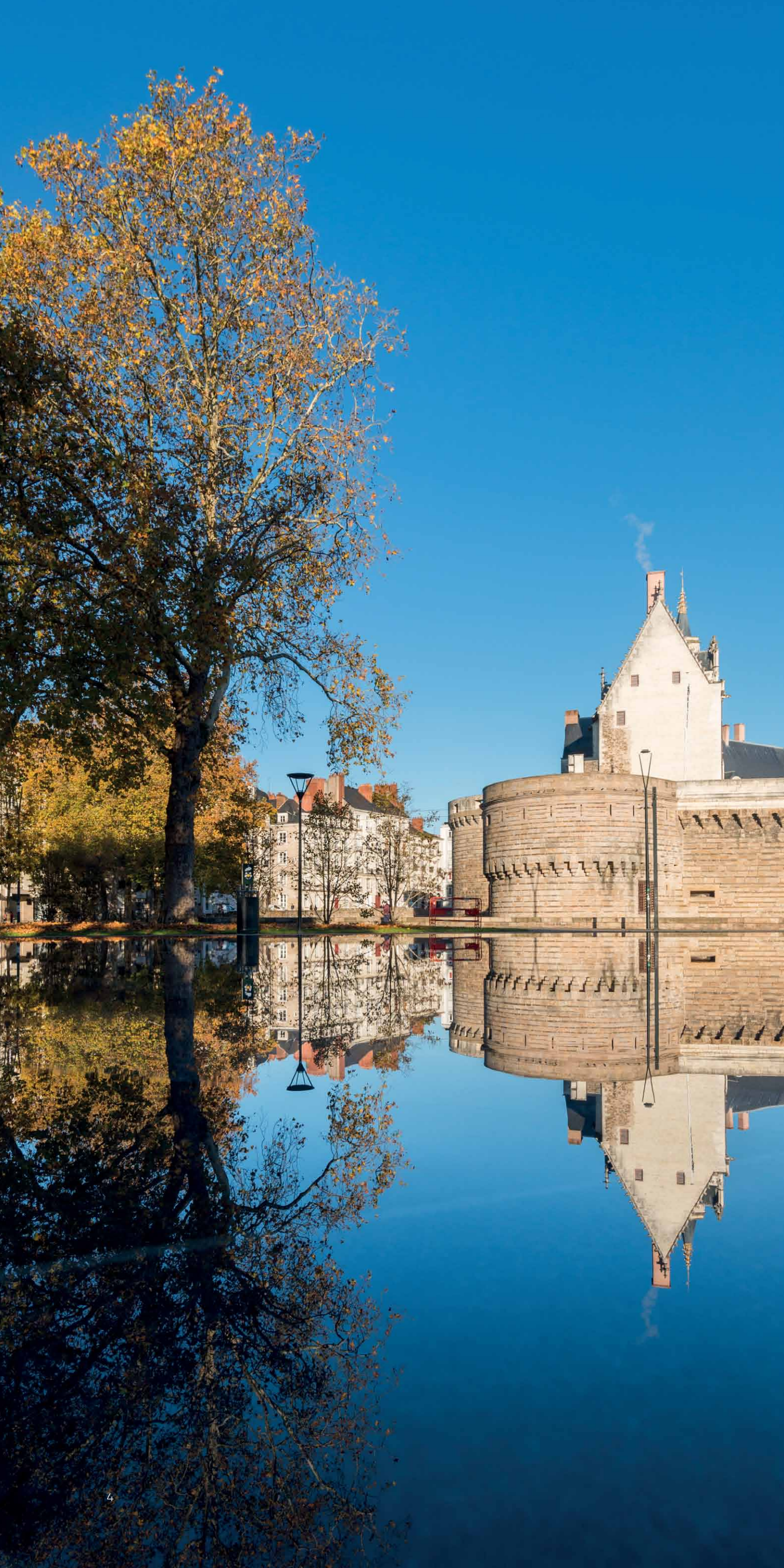
Miroir d'eau devant le Château des ducs de Bretagne