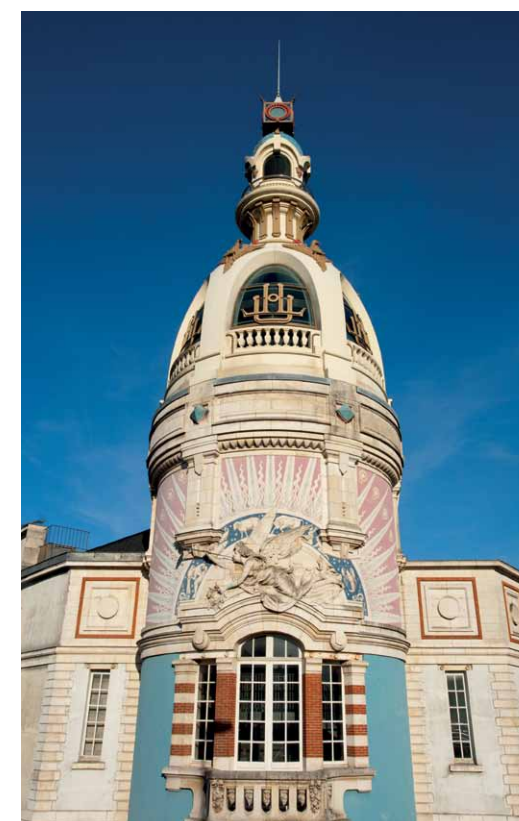
La Tour LU

Nantes est bien tout cela, une ville mixant l'histoire et l'avenir, la nature et la culture. Nantes est exigeante, et elle a raison!