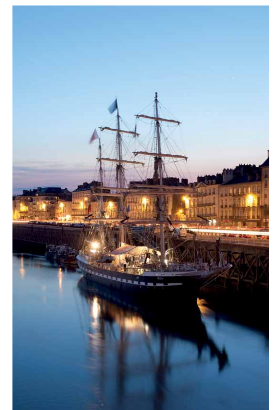
Le Belem, quai de la Fosse